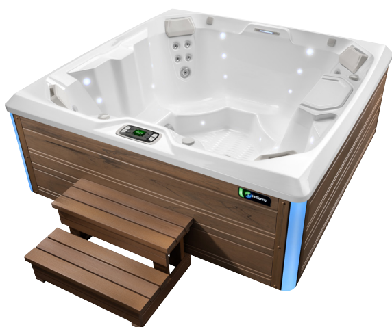
Modèle Beam avec coque Blanc alpin / habillage Sable brun