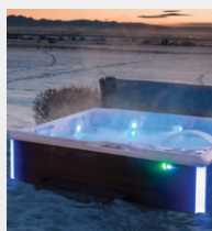
Isolation haute densité FiberCor®