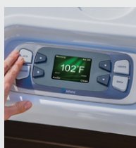
Panneau de commande LCD couleur