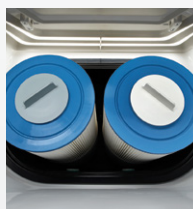
Filtration à action double- Circulation SilentFlo