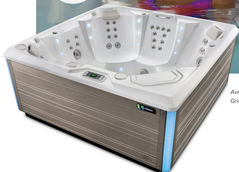
Avec coque Blanc alpin et habillage Gris côtier

Personnes Places Jets Tension 7 places Sans lounge 41 Jets 230 V